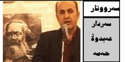
سهره تار سهره دار عه بدو خه به

لیره وه لوهی و باس ده کری ۱۷ ی شوبات ده ستردی ئۆپۆزسیۆن بوو . له لایه ک ده سلات ده یوه ئه م مۆره ی لی بدات به بیانوی ئه وه ی ئۆپۆزسیۆن له هه لپۆاردنی په رله ماندا نه یبرده وه بۆیه ئه م سیناریۆی ساز کرد . له لایه کی تره وه ئۆپۆزسیۆن به ناراسته وخۆ یا به راسته وخۆ ده یوه ی خاهنداریه تی ئه و رۆژه بکات. به لام له ناورۆکدا راستیه کی تر هیه وه شاراوه ش نیه. کاتی له تونس و له میسر شۆرش ده سته یی کرد ، ئه م شۆرشانه لافوکی بوو بۆ رامالینی نا عه داله تی و دیکتاتۆری وه ژاری و کرانی و برسه یه تی ، هه ر زوو ئه م لافوه ناوچه ی وولاتانی تری گرتوه ، ئه م شۆرشانه ده ستردی هیه ک بالیک سیاسی نه بوو به لکو رق وکیه وتوره یی خه لک بوو له به رانبهر بارودۆخیکدا که تیایدا ده ژین. دواتر بزوتنه وه کۆمه لاتیه کان وه ک ئه حزابی راست و چه پ و ئیسلامی سیاسی هاتنه ناوه وه وه هه ریه که یان ویستیان ئه م شۆرشانه به ناراسته ی خۆیاندا به یه ن .